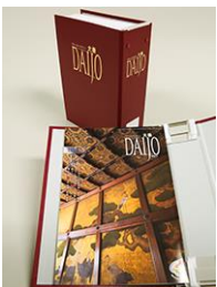
(大乘保存用ファイル)